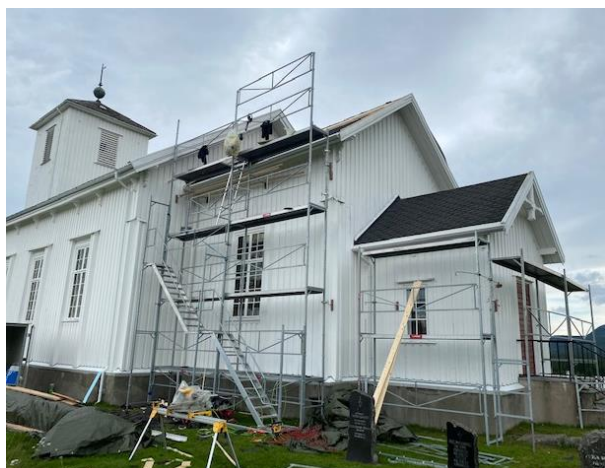
Skifte av tak over korpartiet i Klinga kirke