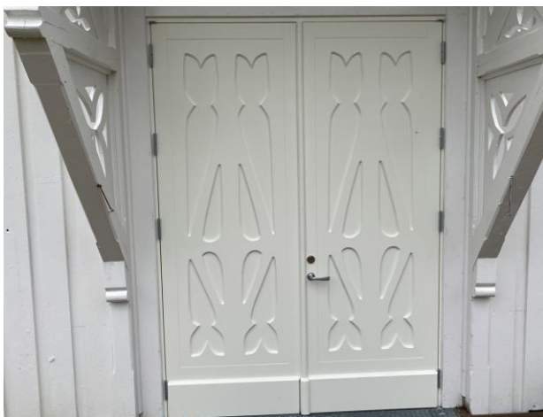
Nye dører i hovedinngangen i Vemundvik kirke