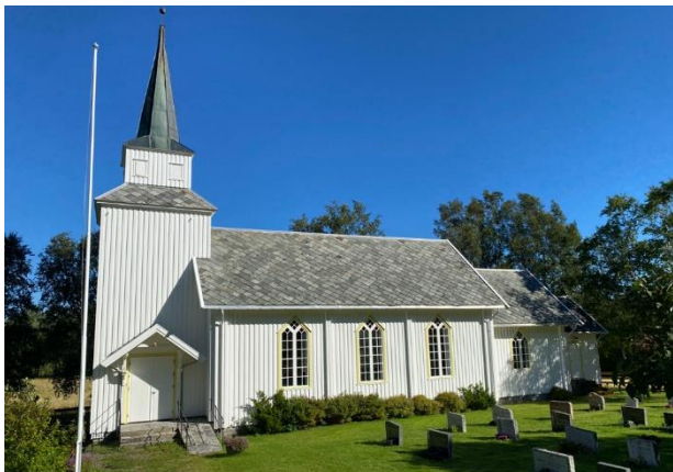
Lund kirke - nymalt