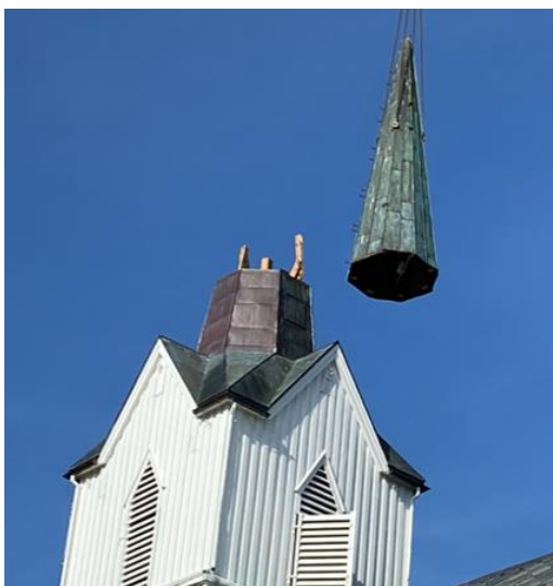
Fra nedfiring av toppen av tårnet og spiret på Skage kirke