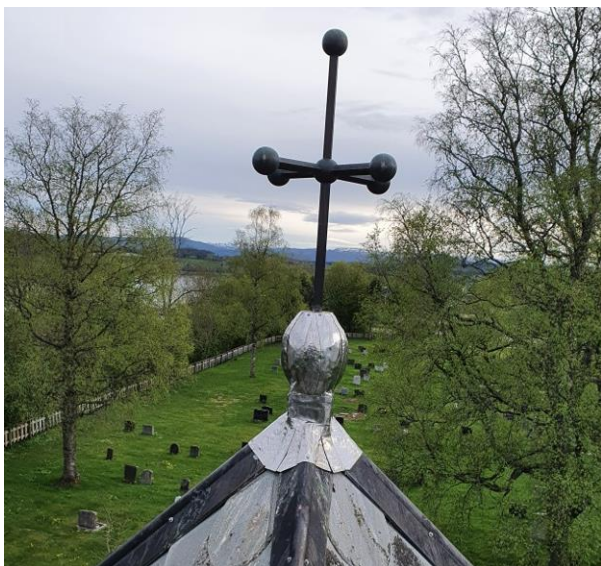
Nytt spir på bårehuset