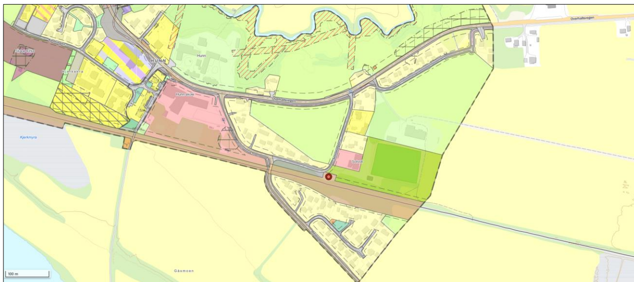
Figur 1. Oversiktskart som viser gjeldende områderegulering for Hunn, med markert område for foreslått endring av arealformål.

Tiltak: Mindre endring av Områderegulering Hunn Eiendom: Solvollvegen 20, gbnr. 13/21 Tiltakshaver: Bane NOR v/ Meland Anne-Kristin