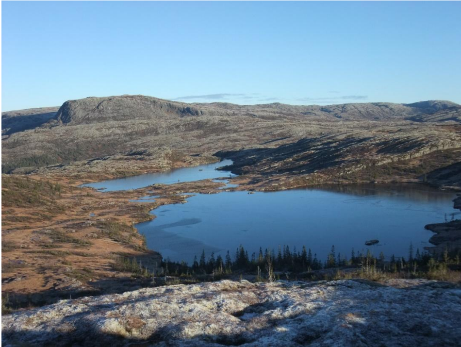
Gåahketjahke (Storengaksla) 527 m.o.h. sett fra sørvest.