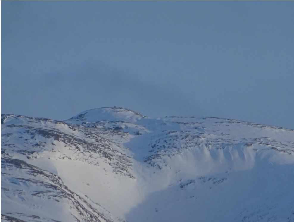
Jorpetjahke (Pinnsylan 597 m.o.h.) sett fra nord.

Det er flere fjell i området som bærer det sørsamiske navnet Jorpetjahke, men det fjellet det her snakkes om er et grensefjell mellom Overhalla og Namsos, vest for Vetterhushatten og øst for Liakammen. Jorpetjahke betyr Rundfjellet.