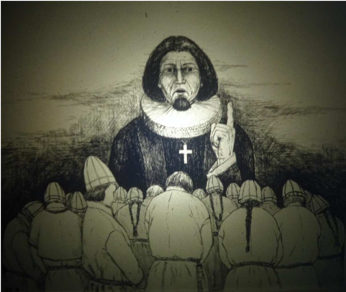
Thomas Von Westen holder preken for sørsamer.

Det kan være interessant å se hva som er skrevet om dette fra en av hans reiser i Overhalla i heftet «Vore brødre lapperne 1906». Der står det « Paa fjeldene i Overhaldens sogn bodde lapper som aldrig var blitt undervist i Guds ords sannheter. De utgjorde 283 personer. De hadde i mands minde ikke været nede i dalene. Prestene der nede visste knapt om dem. Westen fikk nys om dem og vilde besøke dem. Da lapperne fik høre at han skulde komme, samlet de sig og holdt en stor trollmesse og bad alle djævle hindre hans reise ditop. Men Westen kom, saa og vandt ».