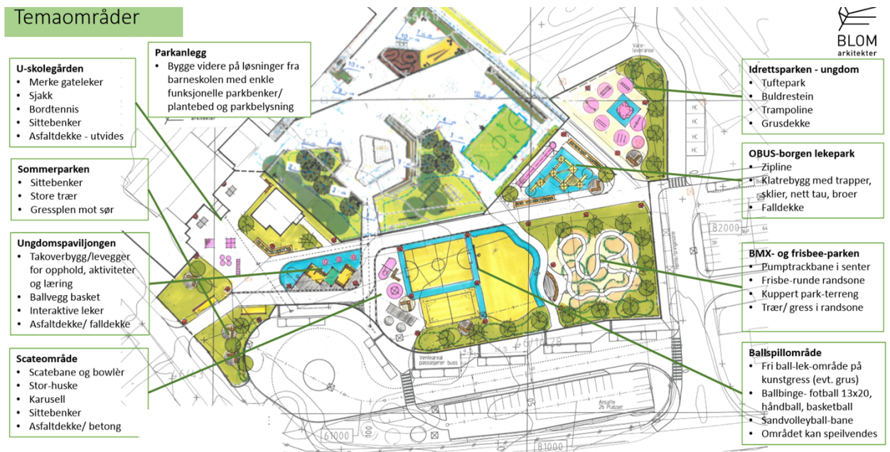
Figur 1: Tidligere utarbeidet situasjonsplan for OBUS uteområde – år 2019