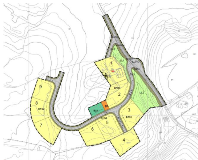
Figur 2 Planområdet