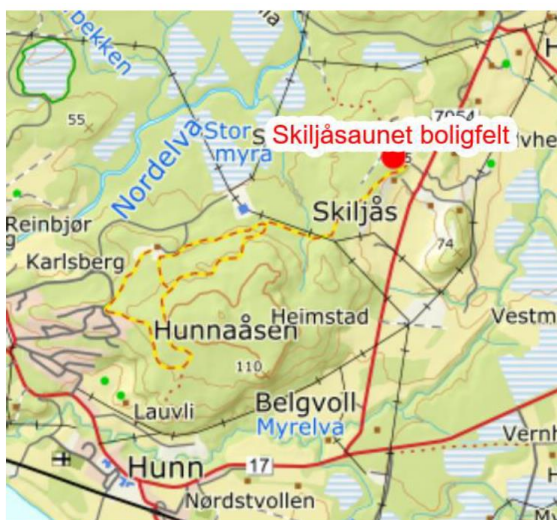
Figur 1 Oversiktskart

Hensikten med reguleringsplanen er å legge til rette for et mindre boligfelt i Skiljåsgrenda som omfatter totalt 9 boligtomter, hvorav en eksisterende bebygd tomt (nr.1) og en godkjent og fradelt tomt (nr.4 - ikke bebygd per i dag).